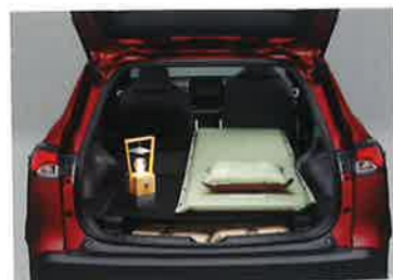
■詳しくは別冊のACCESSORIES & CUSTOMIZE CATALOGUEをご覧ください。

▶ラゲージアクティブボックス [2021年12月発売予定] ラゲージルームにフラットなスペースを生み出します。耐荷重性に優れ、リヤシートを倒してマットを敷けば寝転がることもできます。