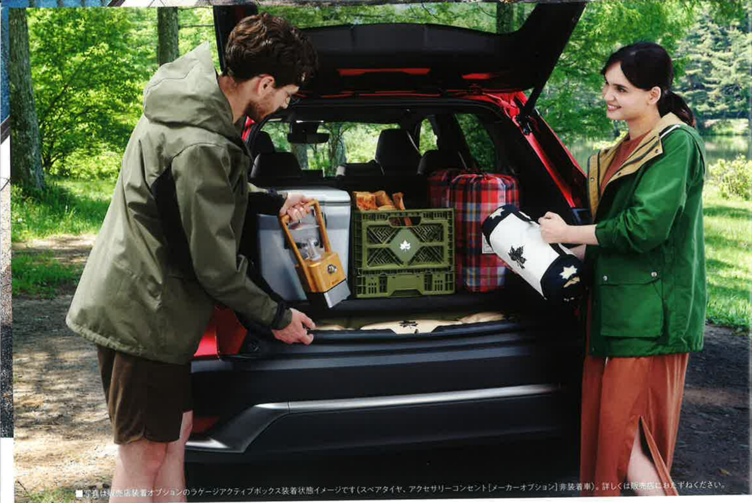
■写真は販売店オプションのラゲージアクティブボックス装着状態イメージです(スベアタイヤ、アクセサリコンセント[メーカーオプション]非装着車)。詳しくは販売店におたずねください。