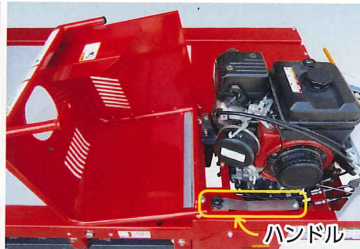
エンジンカバーフルオープン & 調整ハンドルピットリ収納