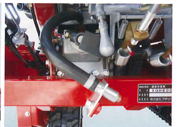
エンジンオイルドレンホース装備