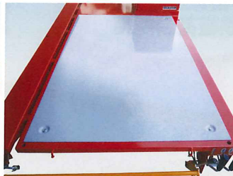
鉄板荷台 & ロープフック