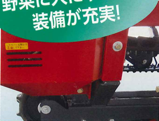
出っ張り少なく野菜を傷つけない 車体サイド部