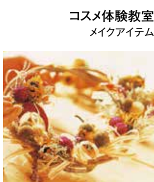
コスメ体験教室 メイクアイテム