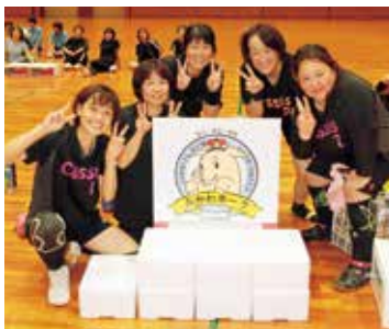
優勝した「城下小町A」のみなさん

10月3日に豊橋市神野新田町の総合体育館で、女性部員24チーム135名が参加し、ソフトバレーボール大会を開催しました。午前中は4チームずつ6ブロックで予選リーグ(総あたり戦)を行い、1位と2位の12チームが午後の決勝トーナメントへと進みました。惜しくも進めなかったチームは予選順位ごとにラッキートーナメントを行い、全チームが終日ソフトバレーボ