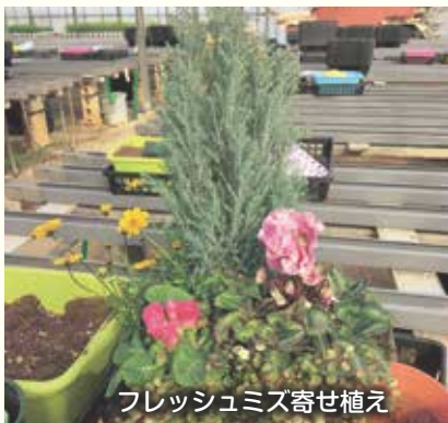
フレッシュミズ寄せ植え

※女性部だよりでの案内は、健康診断募集を除き女性部員向けの募集となっております。女性部へのご加入は最寄の支店にて手続きを行ってください。（年会費500円、印鑑が必要です）