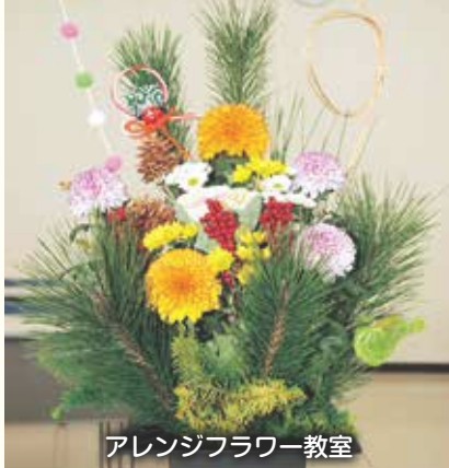
アレンジフラワー教室