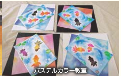
パステルカラー教室