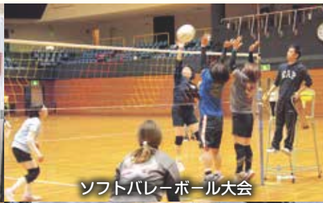
ソフトバレーボール大会