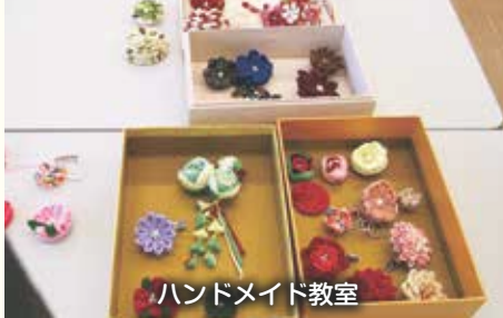
ハンドメイド教室