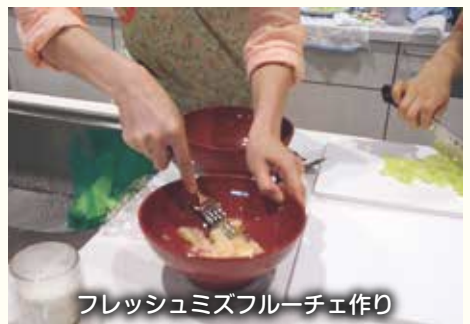
フレッシュミズフルーツチー作り