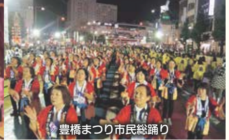
豊橋まつり市民総踊り